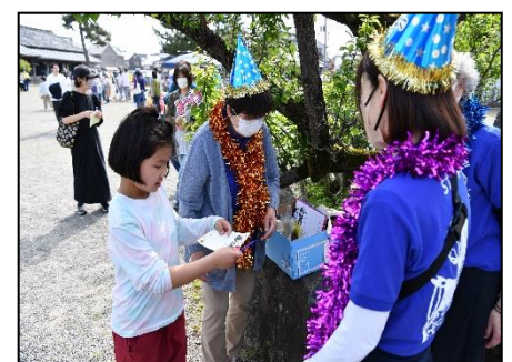
企画で景品をもらう参加者 (白洲)