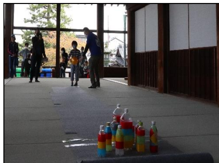
シャカリンピック (本堂縁) —シャカボウラー—