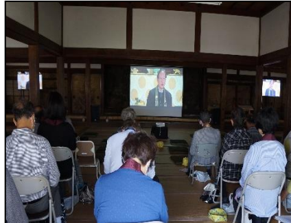
本堂内の様子をライブ配信しました。