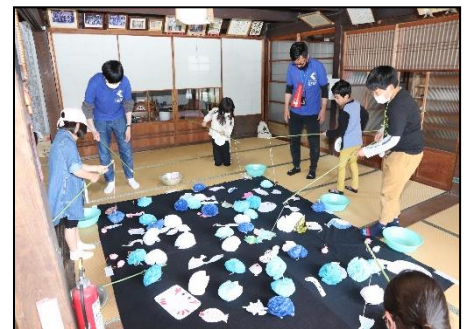
シャカリンピック会場 (総会所) —ハスイケフィッシング—