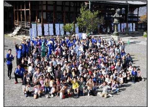
参加者・スタッフ集合写真

5月3日(水・祝)に、長浜別院を会場とし、一堂に会する開催としては約4年ぶりとなる「花まつり子ども大会—やっぱりであうっていいね!」を実施しました。当日は、子ども123名・大人66名・スタッフ38名の方々に参加いただき、お釈迦さまのご誕生をお祝いしました。お勤め後は青少幼年部門委員で紙芝居『おうじさまのごたんじょう』を動画に編集し、放映しました。