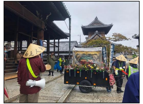
5/7に出発される御影 —長浜別院にて—

本年は長浜別院での宿泊の日程となり、翌日8時30分よりお勤めを行い、9時に「蓮如上人様の長浜別院おた一ちー」と力強い声を響かせながら出発されました。