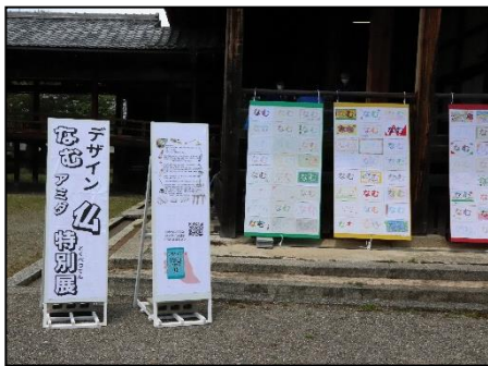
おえかきコンテスト 「デザインなむ・アミダ・仏」特別展

当日は晴天に恵まれ、白洲や総会所などで子どもが遊べるブースや白象などを設置し、参加者もスタッフも元気いっぱい遊んでいました。また、2020年度から3ヶ年にわたり実施した「おえかきコンテスト『デザインなむ・アミダ・仏』」で提出いただいた全作品を本堂の縁に展示しました。参加者からは「楽しかった」「また来たい」との声が多くあり、お会いできる喜び、花まつりを開催する意義を再確認できた大会となりました。