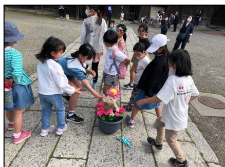
蓮ちゃんを救え! (白洲)