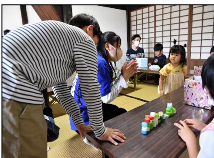
シャカリンピック (太鼓楼) —キャップ積み—