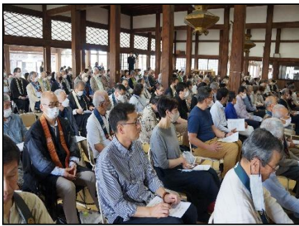
当日は満堂（本堂内）