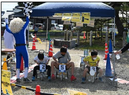
釈迦シャカ三輪車レース (白洲)

当日は晴天に恵まれ、白洲や総会所などで子どもが遊べるブースや白象などを設置し、参加者もスタッフも元気いっぱい遊んでいました。また、2020年度から3ヶ年にわたり実施した「おえかきコンテスト『デザインなむ・アミダ・仏』」で提出いただいた全作品を本堂の縁に展示しました。参加者からは「楽しかった」「また来たい」との声が多くあり、お会いできる喜び、花まつりを開催する意義を再確認できた大会となりました。